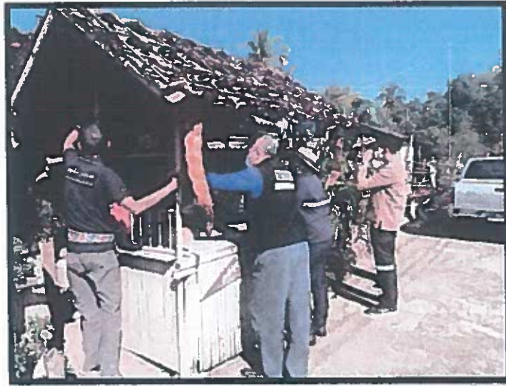
ภาพถ่ายการตรวจสอบข้อเท็จจริง กรณีสิ่งของกีดขวางทางจราจร อันเป็นทางสาธารณประโยชน์ บริเวณ หมู่ที่ ๒ ตำบลเมืองงาย